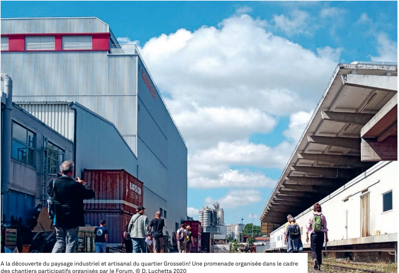
A la découverte du paysage industriel et artisanal du quartier Grosselin! Une promenade organisée dans le cadre des chantiers participatifs organisés par le Forum.

s'émancipe et se pérennise. Régulièrement, se réunissent un grand nombre de citoyen-ne-s, d'expert-e-s, de spécialistes et de passionné-e-s de la fabrique de la ville depuis le premier «Forum ouvert» de cette même année.