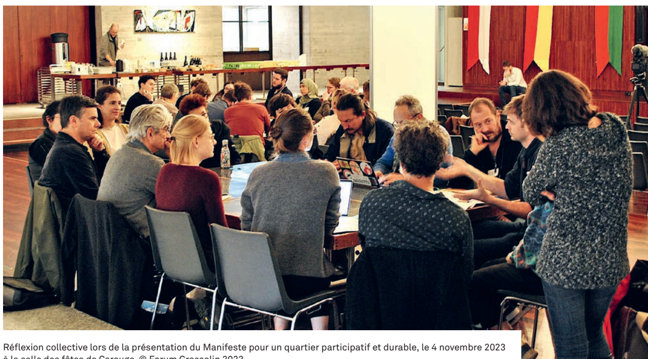
Réflexion collective lors de la présentation du Manifeste pour un quartier participatif et durable, le 4 novembre 2023 à la salle des fêtes de Carouge.

Le Forum Grosselin, avec la participation du consortium de coopératives d'habitation «Grosselin demain» 1 , a présenté publiquement le 4 novembre 2023 un «Manifeste citoyen pour un quartier participatif et durable», une vision porteuse pour ce quartier dans le périmètre Praille Acacias Vernets (PAV).