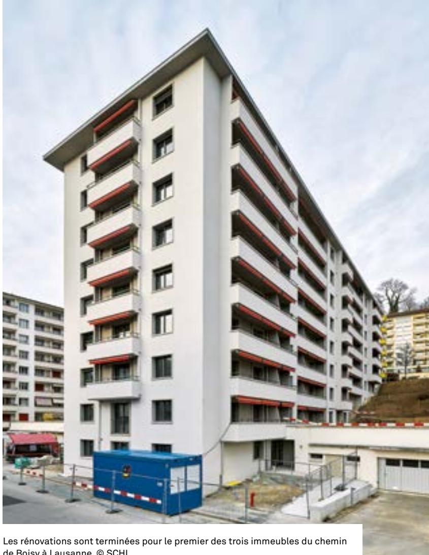
Les rénovations sont terminées pour le premier des trois immeubles du chemin de Boisly à Lausanne.

A l'intérieur des appartements, les transformations sont énergétiques, esthétiques et pratiques: les installations techniques ont été entièrement remplacées, le chauffage au sol a été intégré (exit les radiateurs), les fenêtres ont été agrandies et équipées de triple vitrage (pour une haute propriété isolante et acoustique), du parquet a été installé dans les chambres, des agencements de cuisine neufs ont été ajoutés, ainsi que