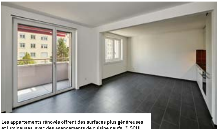
Les appartements rénovés offrent des surfaces plus généreuses et lumineuses, avec des agencements de cuisine neufs.

du carrelage grès cérame au sol dans les espaces de vie. Des cloisons ont été abattues entre les pièces pour offrir des surfaces plus généreuses et lumineuses. Un tiers des appartements ont été adaptés pour les personnes à mobilité réduite. Dans les salles de bains par exemple, les baignoires ont été remplacées par des douches et il est facile d'y installer barres d'appui et sièges rabattables. «La thématique des seniors était un objectif clair durant ces rénovations, car l'idée de construire pour tous est essen-