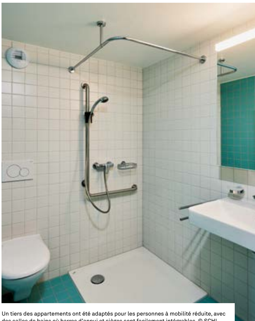
Un tiers des appartements ont été adaptés pour les personnes à mobilité réduite, avec des salles de bains où barres d'appui et sièges sont facilement intégrables.

En visant de meilleures performances énergétiques pour ses bâtiments, la SCHL va au-delà de l'objectif de confort dans les espaces personnels. Elle considère également le bien-être que les habitants pourront trouver à l'extérieur de leurs appartements, là où la vie sociale émerge. La proposition de la SCHL permet des échanges plus pratiques et coopératifs entre les habitants. Elle met ainsi en avant l'importance de considérer tous les aspects – pratiques, énergétiques, humains et sociaux – pour le bien-habiter. ■