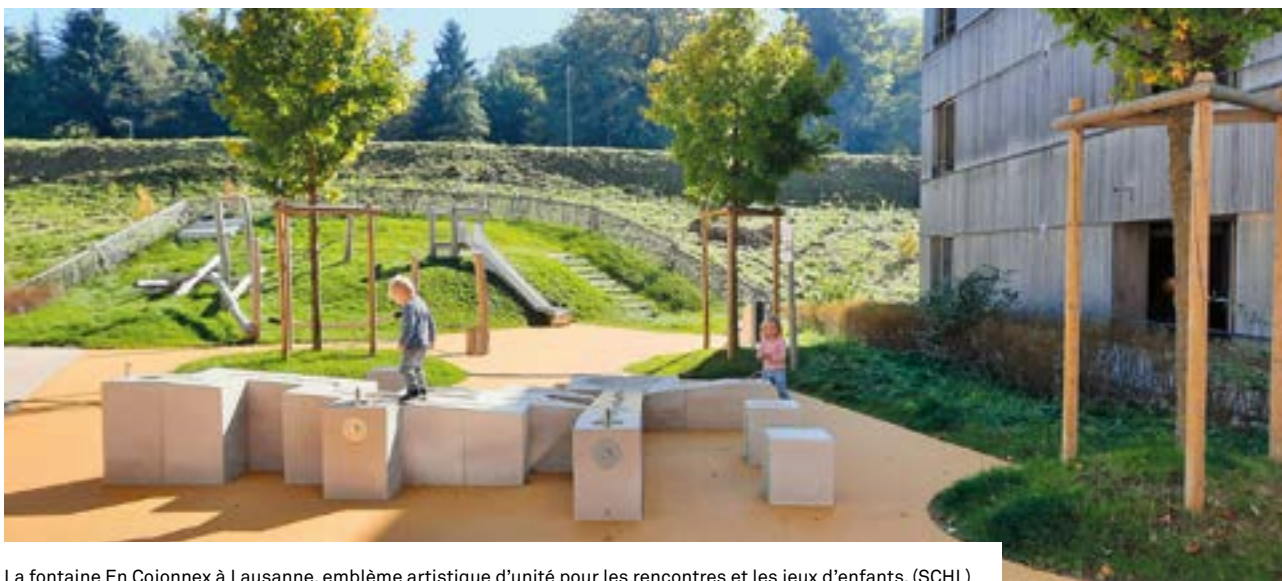
La fontaine En Cojonnex à Lausanne, emblème artistique d'unité pour les rencontres et les jeux d'enfants. (SCHL)

label Minergie-P-A-Eco sont évidemment plus élevés que pour un immeuble standard, mais en qualité de grande coopérative d'habitation, nous tenons à continuer de jouer un rôle de pionnier en la matière – et de toute façon, cette plus-value est un bon investissement pour l'avenir, tant pour l'aspect écologique de notre patrimoine que pour la durabilité de l'immeuble et pour les expériences que nous pourrions en tirer. Ce genre d'immeubles nécessite d'ailleurs un certain apprentissage à l'usage, que nous devons apprendre et appliquer à nos futurs sociétaires-locataires sensibles à l'environnement. Il en va d'ailleurs de même pour tous les immeubles à haute valeur énergétique que nous avons déjà construits et dans lesquels les habitant·e·s signent une charte de comportement les engageant à respecter les nécessités d'usage propres à ce genre de bâtiments. Nous venons aussi de publier une petite brochure, «La bonne énergie», afin de familiariser nos locataires avec les bonnes pratiques pour économiser l'énergie dans leur logement.