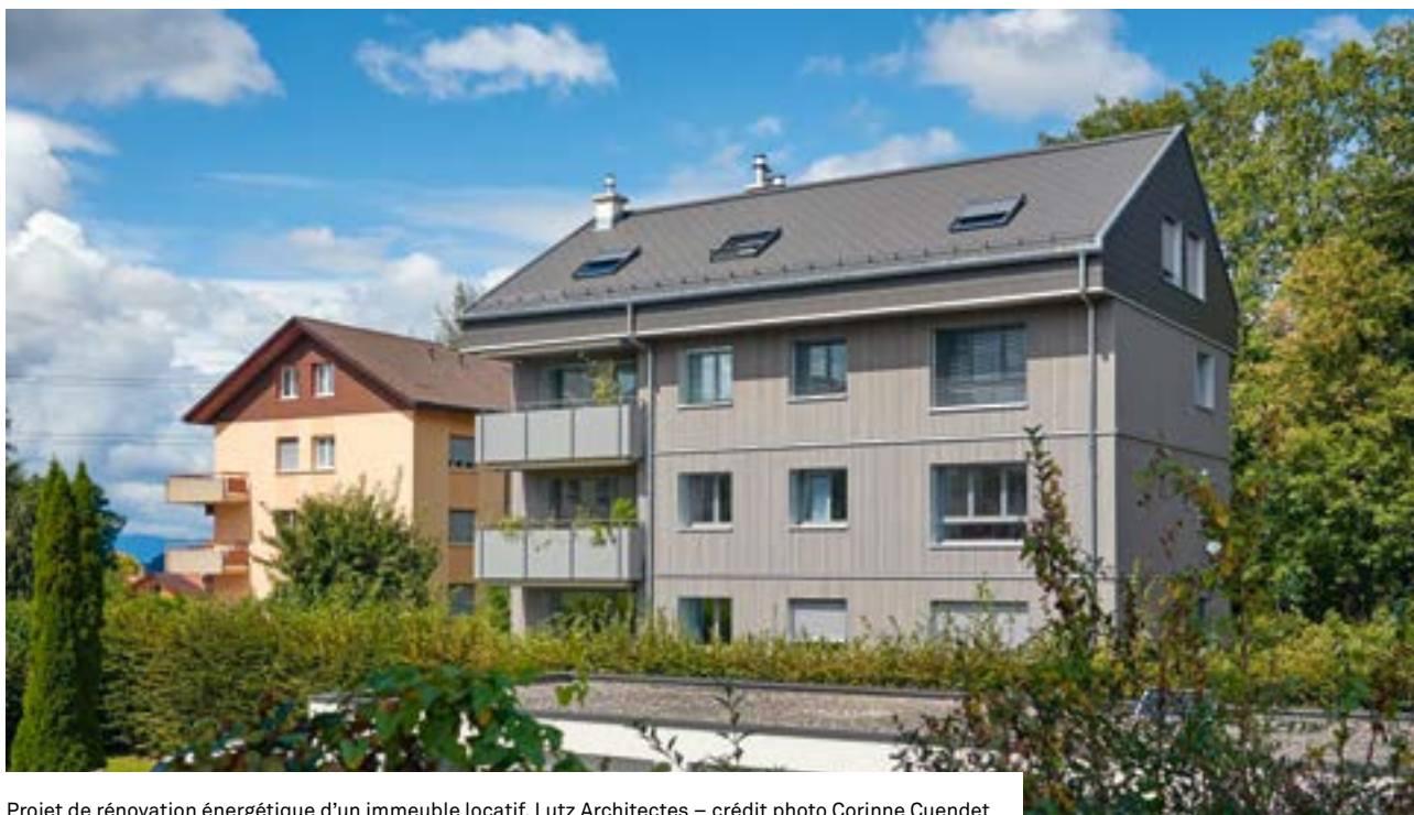
Projet de rénovation énergétique d'un immeuble locatif, Lutz Architectes

ED: Contrairement à un propriétaire privé qui pourrait profiter d'abattements fiscaux en faisant ses travaux par tranches, un MOUP a intérêt à faire tous les travaux en une fois. Les interventions se font chronologiquement dans l'ordre suivant: