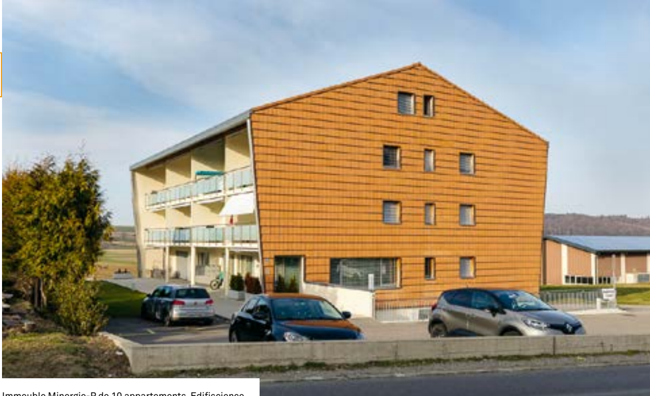
Immeuble Minergie-P de 10 appartements, Edifiscience