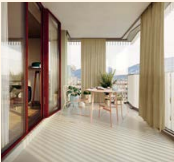
Perspective intérieure, projet d'assainissement énergétique d'une tour de 15 étages au 16-18 Vieusseux, 1203 Genève.

Le projet vise le label Minergie P rénovation. Un parc de panneaux photovoltaïques est installé en toiture afin d'alimenter l'ensemble des installations techniques de la sous-station, l'éclairage des communs, ainsi que les ascenseurs des immeubles. La ventilation mise en place est en simple flux et le chauffage est relié au CAD. La coopérative s'entoure d'un assistant à maîtrise d'ouvrage énergétique (AMOE) et d'une assistante à maîtrise d'usage (AMU) pour sensibiliser les habitants à adopter de nouveaux réflexes énergétiques dans leur nouvel écrin. L'ensemble des subventions représentent environ 12% du budget total des travaux. La demande de subvention est adressée à l'Office cantonal de l'énergie (OCEN) qui valide le bilan thermique, et donne le feu vert aux divers organismes de subventions cantonales, fédérales, et autres.