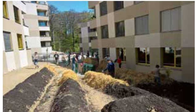
Les habitantes et habitants de l'écoquartier lausannois des Fiches Nord créent leur jardin communautaire dans un esprit participatif. ©? ?

Elle a non seulement un objectif de quantité mais elle souhaite développer des logements de qualité avec un environnement direct et agréable à vivre, des typologies diversifiées, flexibles et innovantes 1 afin de répondre aux différentes demandes d'habiter des lausannois/es. Elle va mettre l'accent sur des logements adaptés aux seniors qui ne vont plus se focaliser sur la seule construction sans obstacle, mais en intégrant également les notions d'environnement approprié, d'évolutivité de cet habitat, d'individualisation possible, de son accessibilité financière ou encore de prestations sur mesure. De plus, elle souhaite continuer à