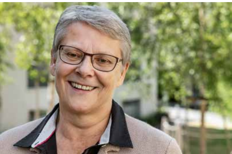
Béatrice Métraux, conseillère d'Etat du canton de Vaud et cheffe du Département des institutions et de la sécurité (DIS)

Selon Béatrice Métraux, conseillère d'Etat et cheffe du Département des institutions et de la sécurité (DIS) du canton de Vaud, la nouvelle loi sur la préservation et la promotion du parc locatif (LPPPL) permettra de donner un peu d'air au marché du logement.