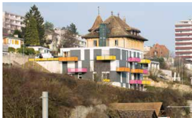
Les nouveaux appartements avec encadrement et leurs balcons colorés aux Vignes du Clos, à Serrières.

Basile Weber, concepteur-rédacteur, Chancellerie du canton de Neuchâtel