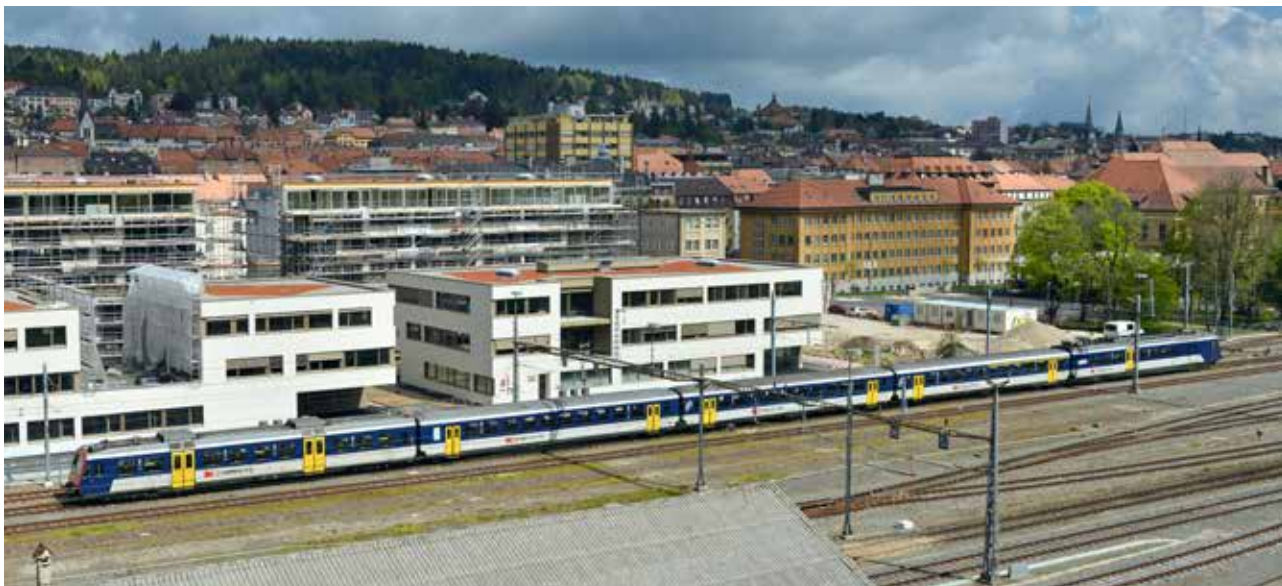
Quartier Durable du Corbusier à La Chaux-de-Fonds durant la construction du premier îlot... la suite reste à inventer!