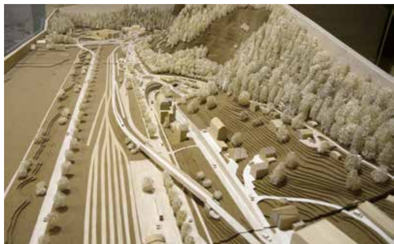
La maquette du futur contournement de la ville du Locle soutenu récemment par le Conseil fédéral.

S'inscrivant dans une planification de développement durable, ces réflexions ont comme but d'améliorer la qua-