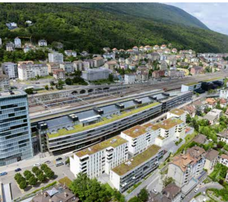
Ecoquartier du plateau de la gare à Neuchâtel: une réhabilitation de friche réussie!

En résumé, la nouvelle LCAT permettra d'apporter de la qualité à nos espaces publics, de cultiver le vivre ensemble, de proposer de nouveaux services de proximité à la population, d'offrir des logements neufs adaptés à des besoins contemporains ainsi que d'assainir et de transformer un parc immobilier avec durabilité. Assurément, la mise en œuvre de la nouvelle LCAT générera de de la valeur ajoutée immobilière, dynamisera le secteur de la construction et soutiendra l'attractivité résidentielle et économique du canton de Neuchâtel. C'est un pari sur l'avenir à relever avec détermination grâce à l'ensemble des acteurs!