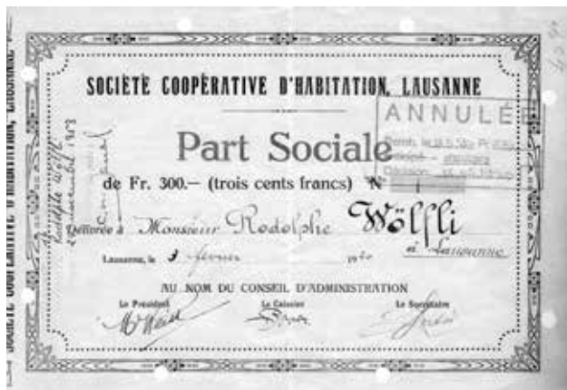
Part sociale de la SCHL en 1920.

La chronique de grandes et anciennes coopératives romandes rappelle à quel point l'environnement et la mission varient peu. Instituts de crédits hésitants, pouvoir publics inquiets. Et quantité de ménages et de personnes seules laissées à l'écart du marché (libre) du logement.