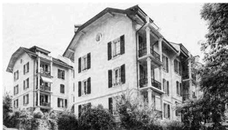
La Maison ouvrière au chemin des Bégonias après les rénovations de 1988.

Retour à Lausanne, où la future Société coopérative de Lausanne (SCHL) est appelée de ses vœux par des membres de l'Union locale du personnel fédéral (ULPF). En 1920, le tribun socialiste genevois Léon Nicole est invité à présenter la toute neuve SCHG. Un municipal lausannois, Arthur Freymond, complète l'affiche. Un comité d'initiative se forme dans la foulée. Des pourparlers sont engagés avec la municipalité, ils sont récompensés par un terrain à Prélaz, qui doit permettre la réalisation de 57 logements minimum. Le modèle de la cité-jardin est alors plébiscité. 200 personnes assistent à l'assemblée générale de 1920. Les statuts mentionnent «La rareté des logements vacants à Lausanne, due à l'arrêt presque complet de la construction de maisons d'habitation, engendre une hausse continue des loyers et menace de devenir un vrai danger pour l'ensemble de la population.»