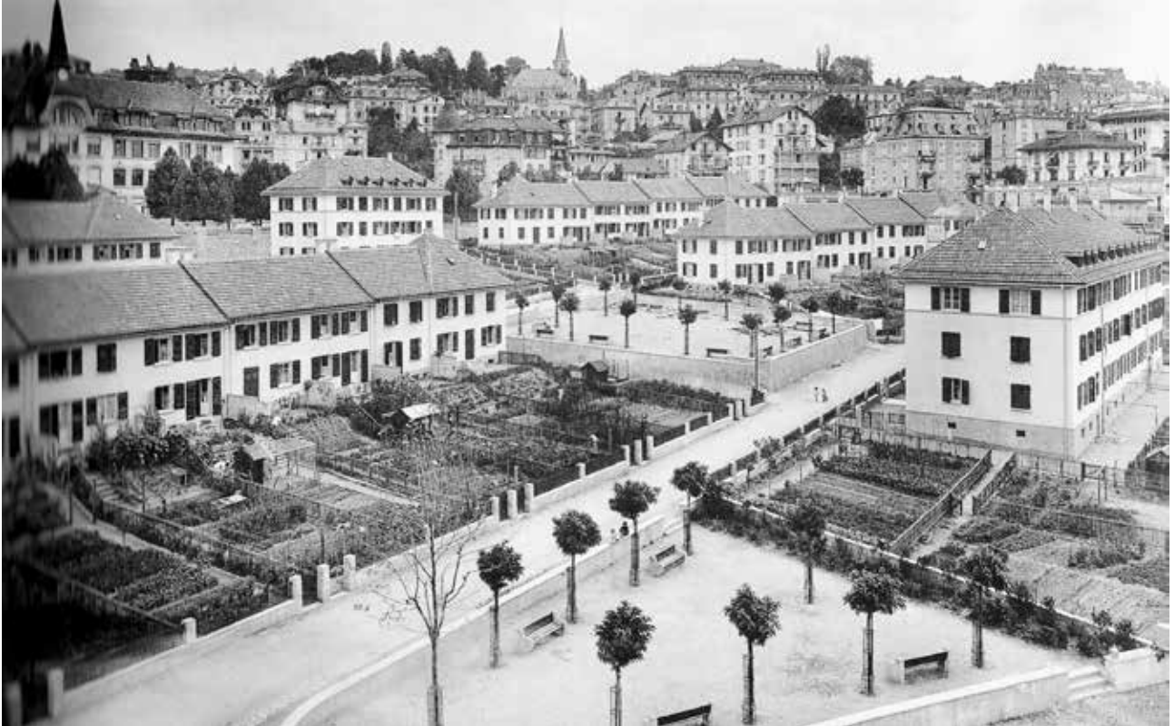
La cité-jardin de la SCHL, à Prélaz en 1922

Pour bénéficier d'une subvention fédérale, les membres doivent souscrire à 1000 parts avant la fin de l'année. Ce minimum, revu à la baisse, est atteint avec de grandes difficultés et grâce au soutien de l'ULPF.