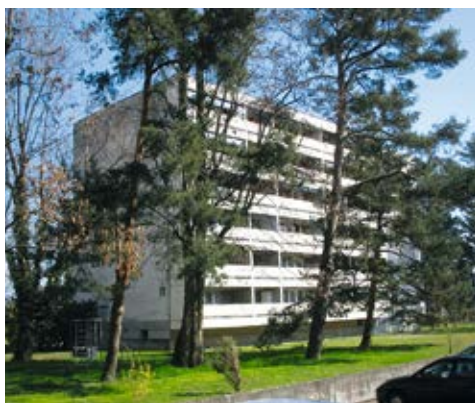
LSR Logement Social Romand SA, Lausanne

Ce sont là des signes forts des liens et de la cohésion qui règnent à l'intérieur de notre