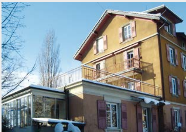
Société coopérative d'habitation Oval 64, Lausanne

132 000 francs furent versés et, en 1981, ce furent déjà 268 000 francs alors qu'en 1982, on franchissait pour la première fois le seuil des 300 000 francs. Les avoirs du fonds ont augmenté en continu et, en 1975, ils dépassaient déjà les deux millions de francs, aidés en cela aussi par les intérêts élevés.