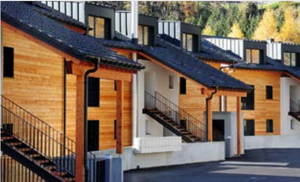
Coopérative Cité Derrière, Ormont-Dessous

Récemment, la fédération a encore amélioré l'harmonisation de ses différents instruments de financement. La règle non écrite en vigueur jusqu'alors, à savoir qu'un maître d'ouvrage ne pouvait toucher de l'argent pour un projet qu'au débit de l'un des deux fonds, ne s'applique plus. Des projets méritant une aide peuvent donc être soutenus plus efficacement encore, grâce à des montants plus importants.