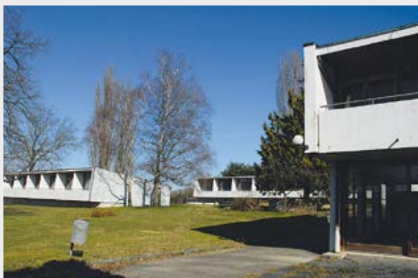
Société coopérative huit et demie, Bernex

Dans les années septante, l'économie s'est développée d'une façon devenue malsaine: le renchérissement atteignait régulièrement les six pour cent durant la première moitié de la décennie et les intérêts hypothécaires atteignaient eux aussi ce taux. Cette évolution prit brutalement fin par la suite, avec la crise pétrolière de 1973: l'économie s'effondra et jusqu'en 1976, les investissements dans la construction ont diminué d'un tiers.