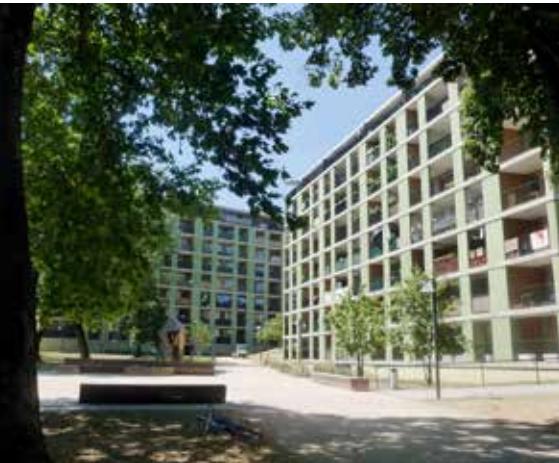
Première collaboration de la FVGLS et de la BAS, deux immeubles avenue de France (91 logements).

draît que le propriétaire des terrains, la Ville de Genève, accorde des droits de superficie à «sa» fondation. Miltos Thomaidis le concède. Mais, les arcanes de la politique étant ce qu'ils sont, il préfère attendre avant de réjouir.