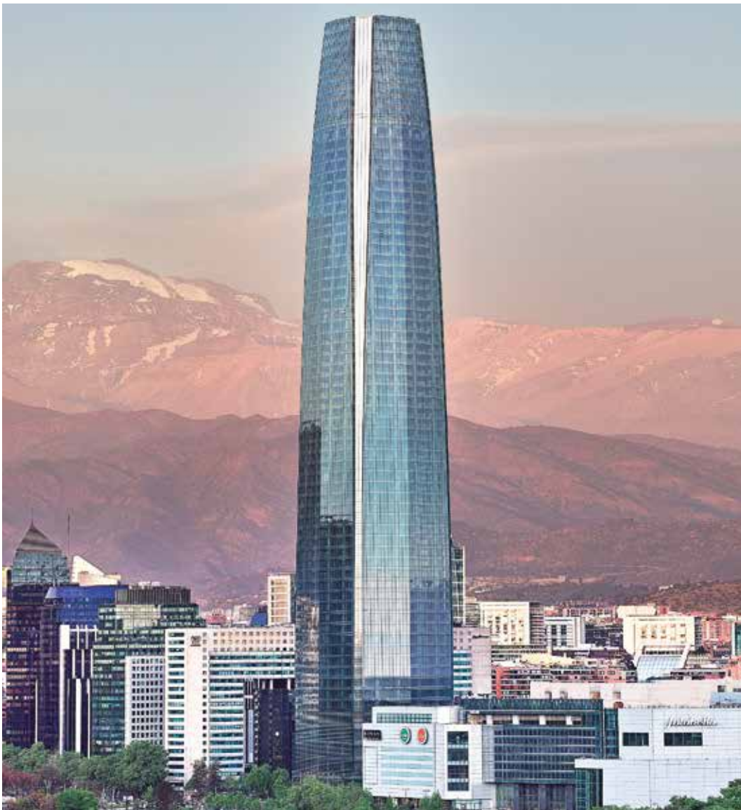
Costanera Center, Santiago, Chile