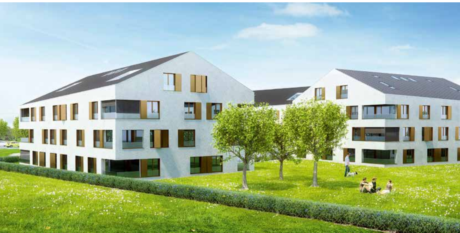
Les immeubles de la commune de Borex