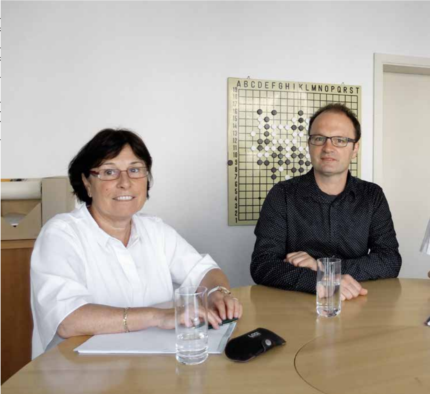
Table ronde à Bienne

Environ 15% du parc immobilier sont aujourd'hui aux mains des maîtres d'ouvrage d'utilité publique à Bienne. Cela peut paraître beaucoup, mais historiquement, c'est plutôt une érosion par rapport aux 20% d'antan. Les coopératives d'habitation et de construction biennoises montent au créneau.