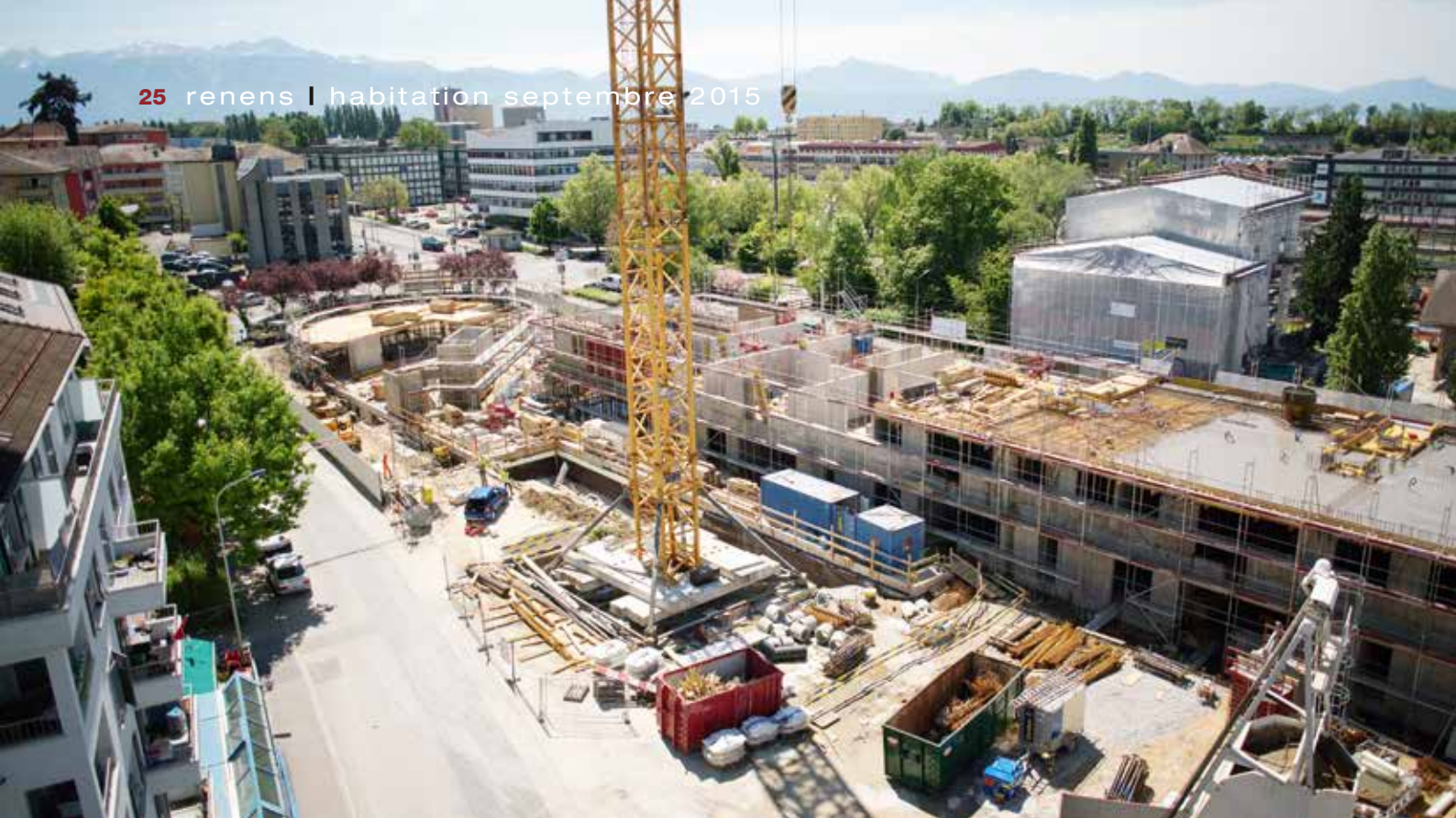
Le chantier de La Croisée