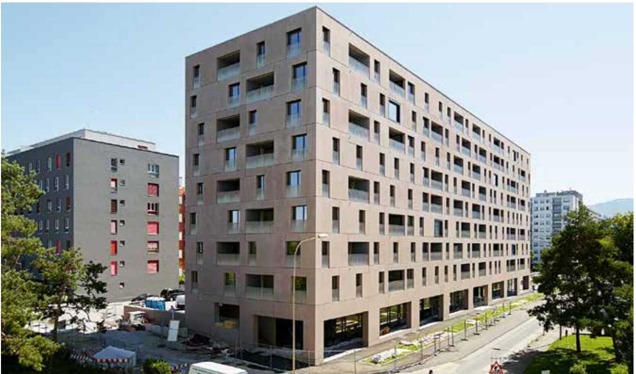
Les Communailles. Un travail sur les façades confère élégance et légèreté à ce paquebot de 96 logements.

Le 12-14 rue de Bandol avait été construit sous le régime du HCM, une catégorie dans laquelle les loyers étaient surveillés par l'Etat pendant 10 ans – contre 20 pour les HLM. «Il est sorti du régime de contrôle en