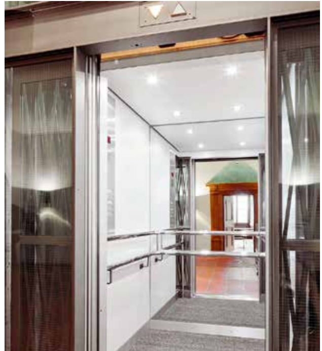
Une cabine plus lumineuse, grâce à un nouveau plafond lumineux.

L'ascenseur, un gage de modernité au cœur du château, affiche une présence imposante.