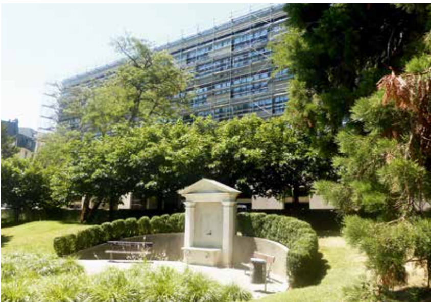
Les emménagements de cet immeuble de 113 logements se dérouleront en octobre. Il s'agit de la première réalisation de l'écoquartier de la Jonction.

Cet été, la FVGLS a aussi obtenu les résultats du concours d'investisseurs mobilisés pour la ré-urbanisation du site de la caserne des Vernets. Elle aura la charge de réaliser 300 logements. Autre attendu d'envergure: la participation à la reconstruction du secteur de la gare des Eaux-Vives. La réalisation de la ligne ferroviaire du Cornavin-Eaux-Vives-Annemasse (CEVA), qui devrait être achevée en 2019, a favorisé des projets d'urbanisation importants autour de plusieurs gares. Dans le cas de celle des Eaux-Vives, la logique vou-