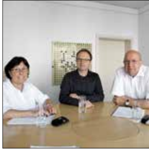
Table ronde à Bienne

Devant la lente mais permanente érosion de leur part de marché immobilier, les coopératives d'habitation et de construction biennoises montent au créneau. Avec panache et succès.