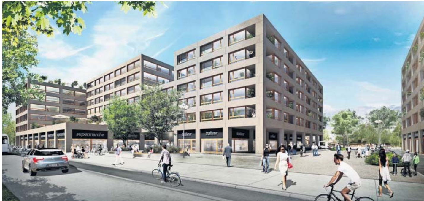
Au cœur du futur quartier: une grande place s'ouvrant sur un grand mail traversant tout le périmètre.

Les Communaux d'Ambilly font partie des trois grands projets de logements initiés il y a une douzaine d'années. Les Vergers à Meyrin et La Chapelle à Lancy sont en cours de construction. Le projet des Communaux a, lui, connu davantage de déboires. Le Canton a